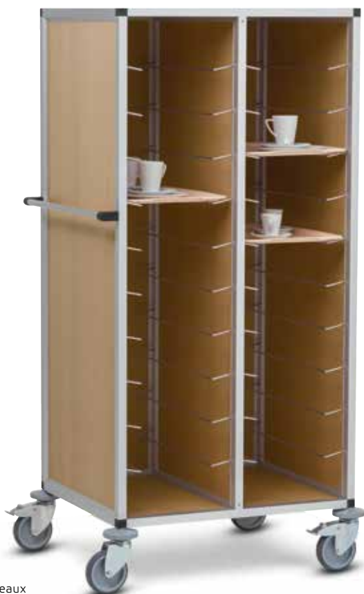
TBL 20 Chariot porte-plateaux