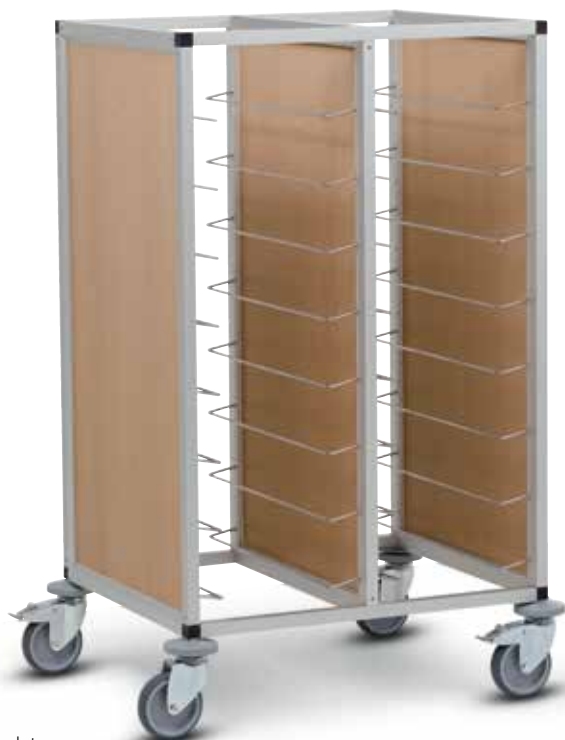
TBL 16 Chariot porte-plateaux