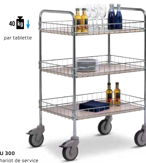
EU 300 Chariot de service