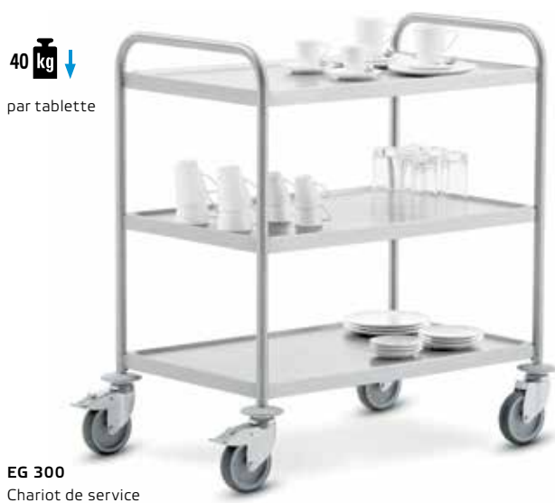
EG 300 Chariot de service