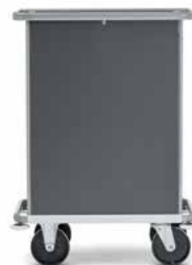
MBW-SECURE Décor anthracite

■ Pour un service du minibar fiable. Modèle optimisé grâce à un nouvel agencement des casiers de tiroir, des poignées encastrées optimisées et des pare-chocs encore plus efficaces.